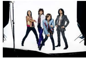
THE YELLOW MONKEY