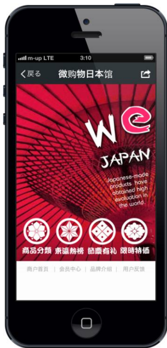
<『微購物日本館』トップページ>