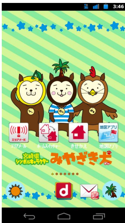
(例) コンテンツイメージ

Android スマートフォンのホーム画面やロック画面などをカスタマイズできます。