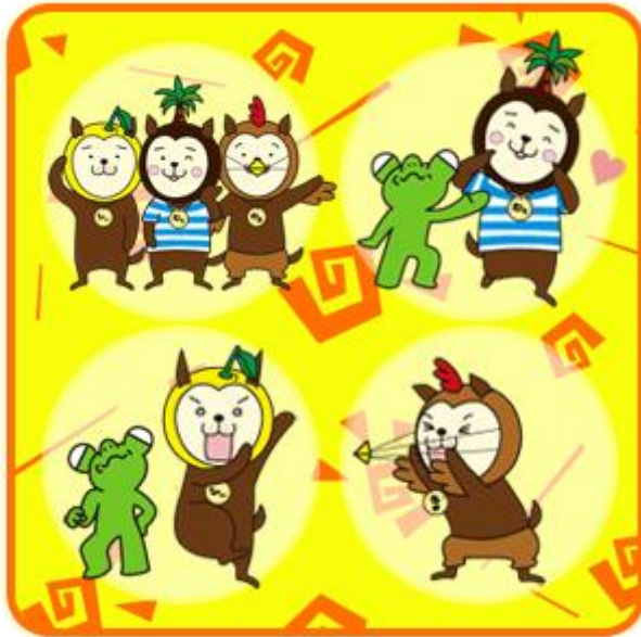
(例) コンテンツイメージ