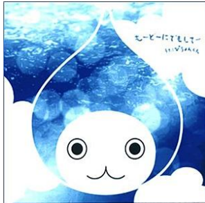
【2002年に発売されたCD 「も〜ど〜にでもして〜」】

2000年夏に登場、2001年春夏に放映されたTVCMで人気急上昇し、「CMソングのCDを買いたい」との多数の声を受け2002年6月にCD『も〜ど〜にでもして〜』を発売しました。発売翌日のオリコンデイリーチャートでは9位にランクイン、10万枚を超えるヒットとなり、TVや雑誌などマスコミに数多くとりあげられ、世の中に大きな話題を呼んだ。また2003年には第2弾CMソングCD『ウタタウタ』を発売し、10万枚の売上を記録した。