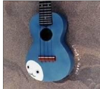
【2005年に発売されたCD 「リビング イン ハワイ」】