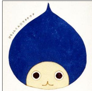
【2003年に発売されたCD 「ウタタウタ」】