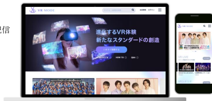
VR MODE WEB サービスページ

近年、ライブ・エンタテインメント市場は拡大成長を続けておりましたが、今回の新型コロナウイルス感染症 (COVID-19) による影響で、ライブ・コンサート・舞台などは、依然として開催できない状況が続いております。そのような中、いかにアーティスト・タレントとファンをつなぎ、ファンの応援する力をアーティスト・タレントに還元するかが早急の課題となっており、今まで以上に世界中で配信サービスが注目されています。