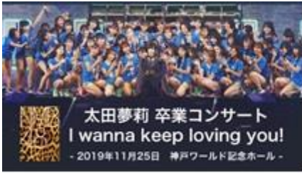
VR LIVE (NMB48)