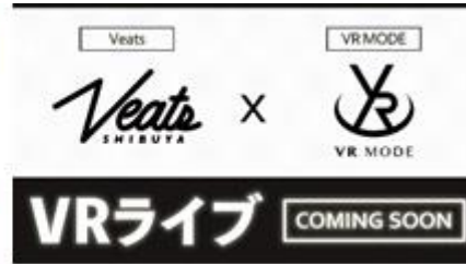
VR 写真集 (セントフォースとの提携) VR LIVE 生配信 (ビクター Veats との提携)