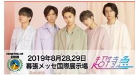
VR LIVE (超特急)