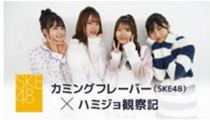
VR シナリオ (SKE48)