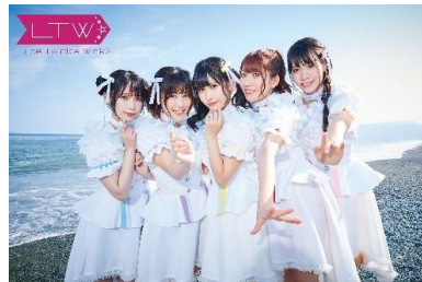
「Luce twinkle wink ☆」