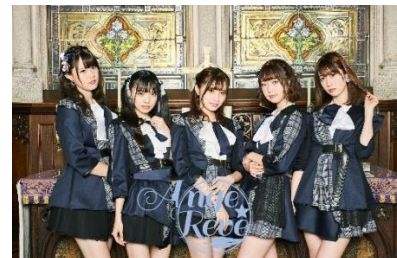
「Ange ☆ Reve」

タイトル：アークジュエル VR 生配信 LIVE 「VR Jewel Beat!!」