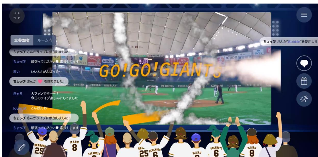
▲観戦画面イメージ（11月21日の配信は、実況の様子のみ配信します。）