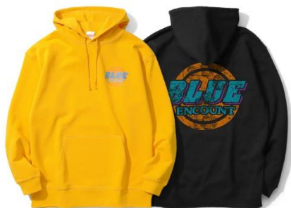
Old Clothes Hoodie

color Yellow / Black size S / M / L / XL price ¥5,800 tax in