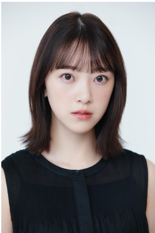
堀 未央奈 (ほり みおな)

1996年10月15日生まれ。岐阜県出身。 13年に第2期生として乃木坂46に加入。 7thシングル『バレッタ』の選抜発表で初選抜。センターを務める。 2017年女性ファッション誌「ar」のレギュラーモデルに。 同年初のソロ写真集『君らしさ』（主婦と生活社）を発売。 2021年3月28日をもって乃木坂46を卒業し、女優業を中心として活動中。 7月13日（火）よりMBS/TBSドラマイズム枠にて放送の「サレタガワのブルー」ではW主演を務める。