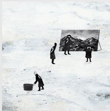
Fill her up