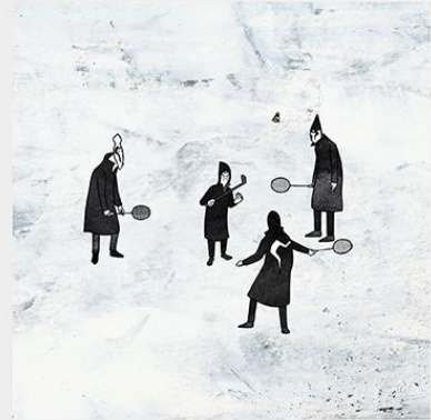
Who is the evil ?