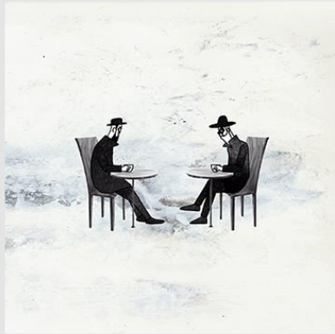
LAST ADAM & EVE