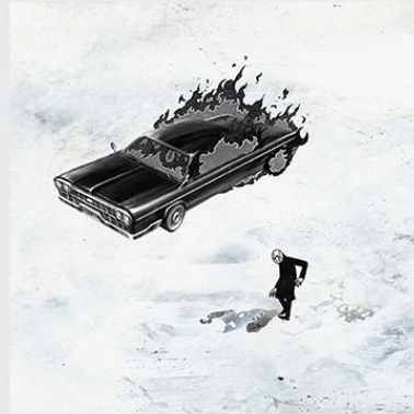
It's All For Us