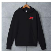
【月刊ムー】ワンポイントパーカー 創刊500号年記念ロゴ ¥6,000