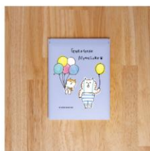
【ごろごろにゃんすけ】フロストスクエアミラー(風船) ¥2,000