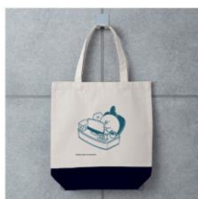
【毎日ぶどり】お仕事中ツートートバッグ ¥2,700