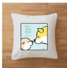
【しばんばん】クッション(向き合い) ¥5,000

Tシャツ、パーカー、トートバッグ、フェイスタオル、ハンカチタオル、ミラー、ポーチ、マグカップ、クッション