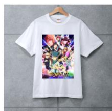
【パリピ孔明】Tシャツ ¥2,980