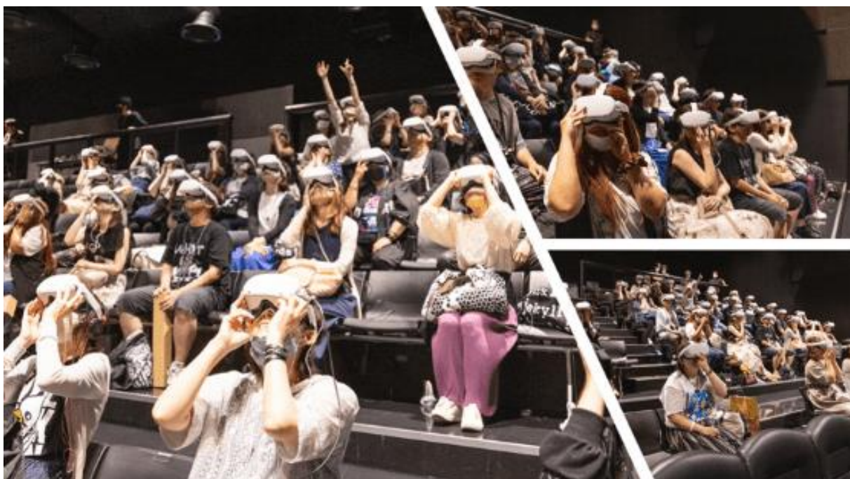
※イメージ画像(VR一斉配信イベントの様様)

今後も、本システムを活用し、ローソン・ユナイテッドシネマグループでのVR一斉配信イベントや、全国のライブハウス、ポップアップストア、ミュージアム等でのVR導入を継続的に推進して参ります。