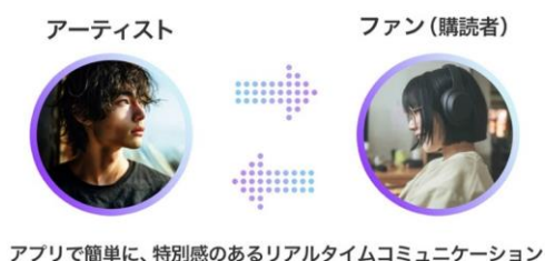
アプリで簡単に、特別感のあるリアルタイムコミュニケーション

アプリはグローバル対応しており、世界200カ国以上のエンターテインメントファンが利用可能です。