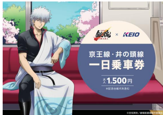
＜京王線・井の頭線一日乗車券＞