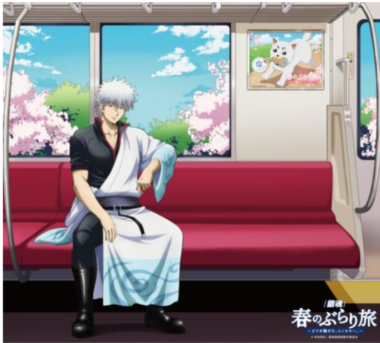
＜京王電鉄コラボ用描き下ろし＞

キービジュアルに使用している描き下ろしイラストに加え、坂田銀時が京王電鉄車両に座る別バージョンの描き下ろしビジュアルも登場！記念乗車券、銀魂トレイン、コラボグッズ、キャラクターパネル等へスペシャル感満載で展開！