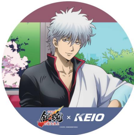
＜京王井の頭線ヘッドマーク（イメージ）＞

「銀魂トレイン」車内では坂田銀時による録り下ろしスペシャルアナウンスを放送。また、新宿駅、調布駅、高幡不動駅、高尾駅、渋谷駅の駅構内では、坂田銀時、土方十四郎、神威の3キャラクターによる告知放送を行います。