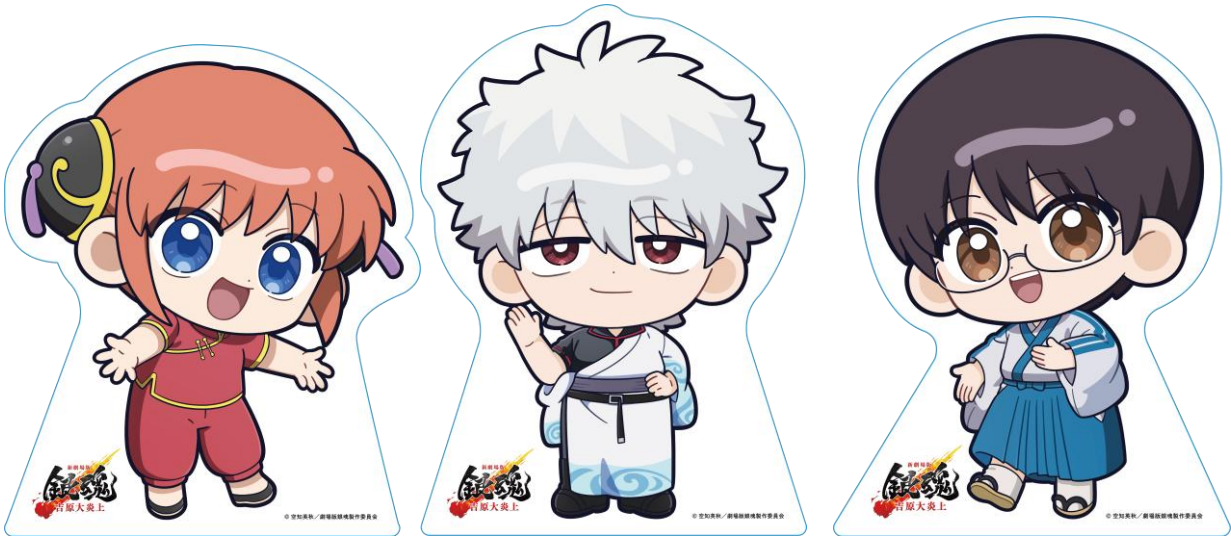
＜キャラクターパネル例＞

新宿コース、調布コース、高幡不動コース、高尾コースの4コースのデジタルスタンプラリーをご用意。 各スポットに設置されたキャラクターパネルやAR フォトで記念撮影も楽しめます。