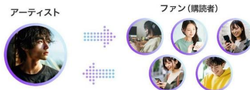
アプリで簡単に、特別感のあるリアルタイムコミュニケーション

アーティストにとっては自分のファンだけが集まる安心できる空間であり、ファンにとってもメッセージが他の人に見られないクローズドな環境であることから、双方が自然体で楽しめる点が高く評価されています。