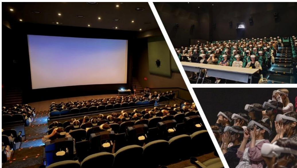
※参考：ユナイテッドシネマでのVRシアター上映イベントの様様