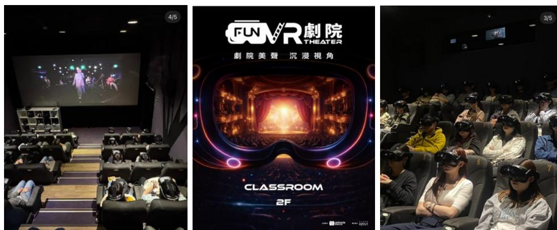
※参考：台湾Fun VR劇院でのVRシアター上映イベントの様様